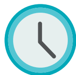
czas trwania podróży